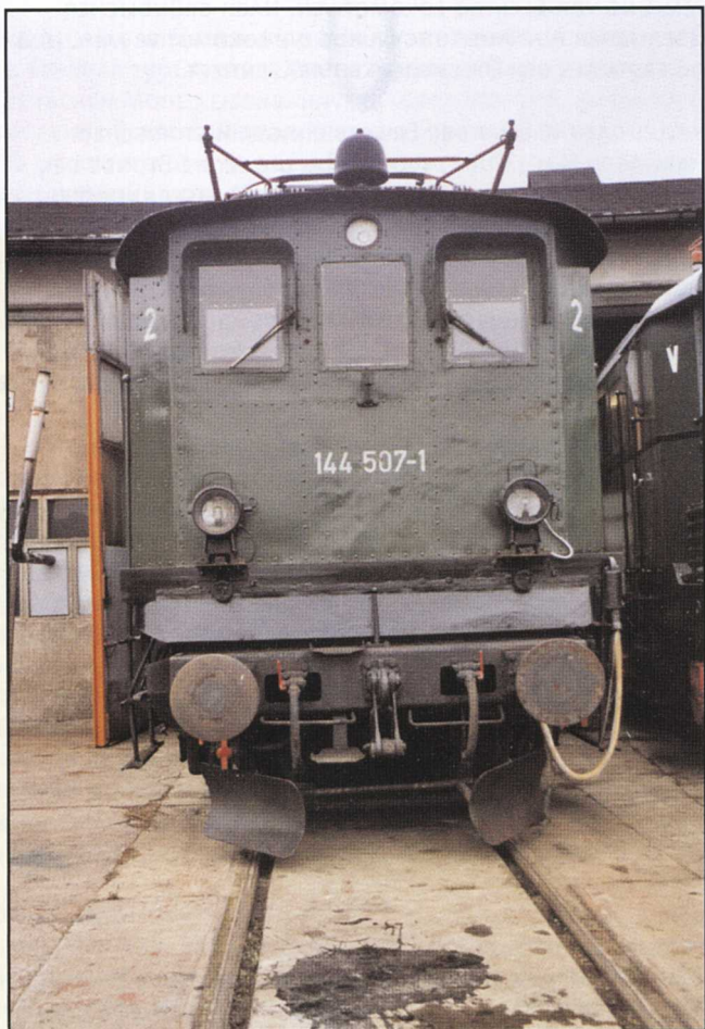
144507-1 (EX E44507) EX DB AEG 1934-FABRIK-NR. 4803 LETZTES BW: FREILASSING LEIHGABE DB-MUSEUM, NÜRNBERG