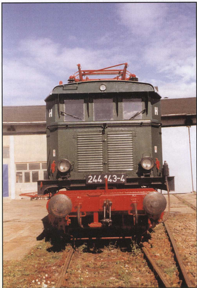
244143-4 (EX E44143) EX DR SSW/HENSCHEL 1942-FABRIK-NR. 25384 LETZTES BW: SCHWERIN